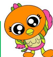
元気一番!! ふっちゃん体操イメージ キャラクター ひびー